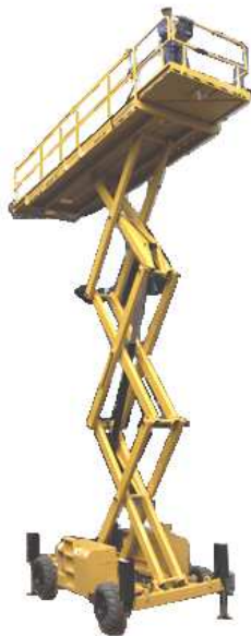
Plate forme extra large