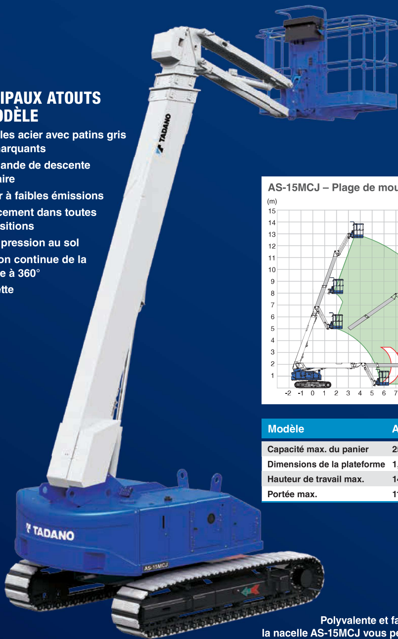
AS-15MCJ – Plage de mouvements