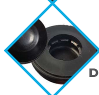
SYSTÈME DE BLOCAGE DE ROUE RENFORCÉ