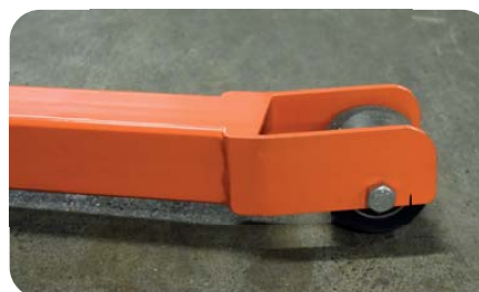
SUR MODÈLE SC1000 : HAUTEUR GARDE AU SOL RESTREINTE 90 MM