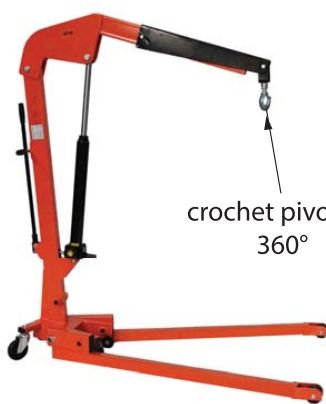
crochet pivotant 360°